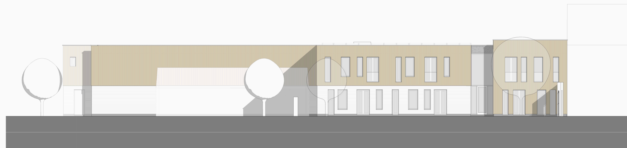
achtergevel – patio zijde maasstraat