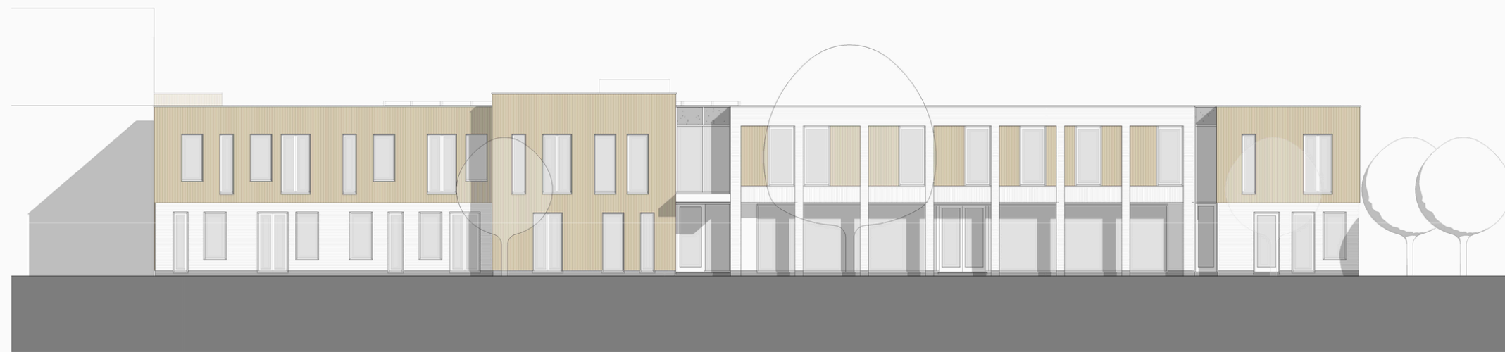
voorgevel – entreezijde de kemp